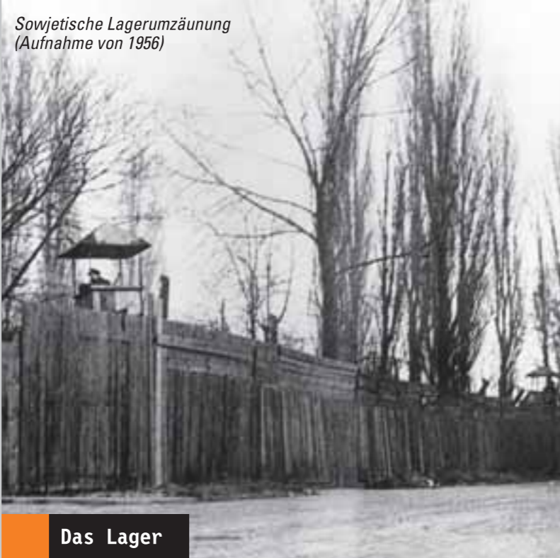
Sowjetische Lagerumzäunung (Aufnahme von 1956)